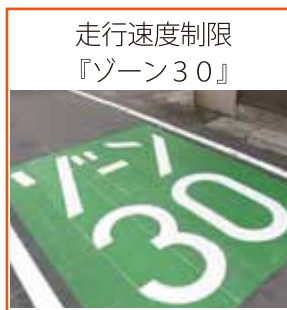
走行速度制限『ゾーン30』

http://gikai.city.shinagawa.tokyo.jp/councillors/konno_takako